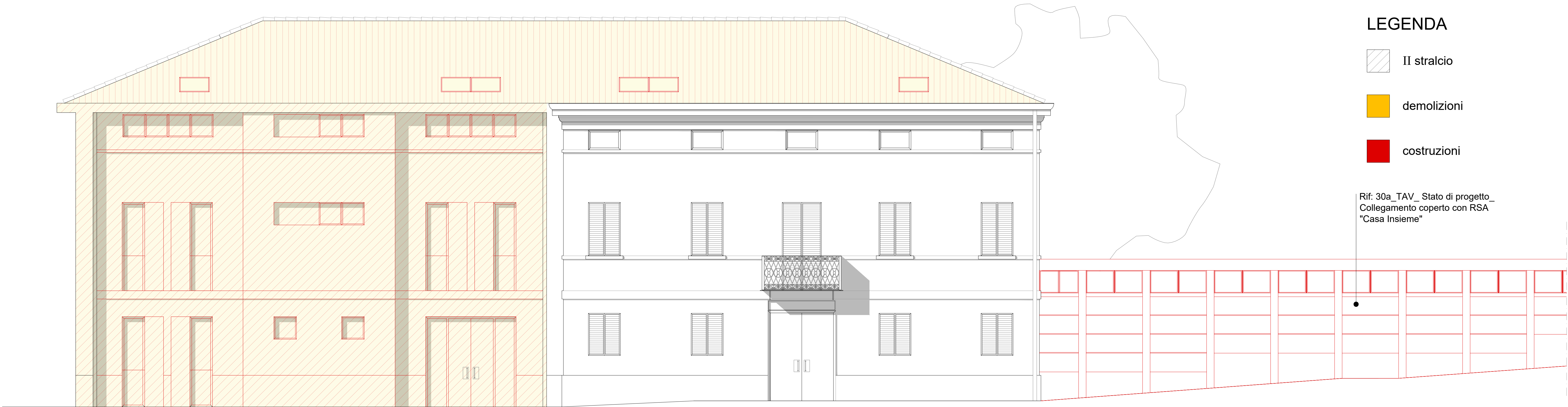
PROSPETTO SUD - OVEST